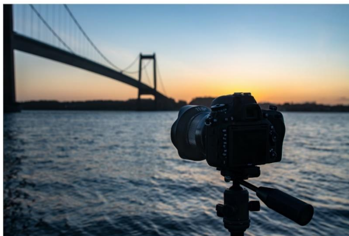
Olivier Jarry-Lacombe OLTRIPOLPHOTOS

Warto również wspomnieć, że wydajność optyczna jest znakomita, a dystorsja wyjątkowo znikoma. Jestem zaszczycony, że mogłem wypróbować ten obiektyw, a teraz stał się on nieodzownym elementem spoczywającym w mojej fotograficznej torbie, gdziekolwiek się wybieram 😊! Wypróbujcie go sami, a na pewno nie pożałujecie!